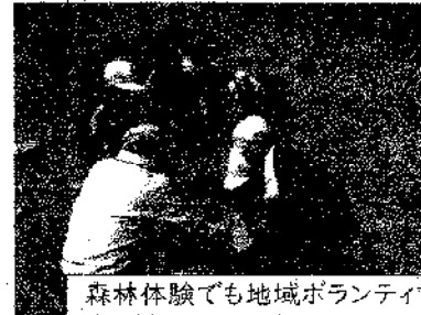
森林体験でも地域ボランティアの方が参加してくださいました。

■依然コロナ禍の状況が続いていますが、今年度は学校行事等に保護者や地域の皆さまにたくさん関わっていただけるように、声掛けしたいと考えております。とりわけ、校外活動実施時に、子どもたちの安全確保や見守りにご協力いただくとありがたいです。(その際には、募集人数もお知らせし、事前の打ち合わせもさせていただきます) 今後、メール配信等で、行事の前にボランティアの募集をさせていただきますので、参加いただけるようでしたら学校までお知らせください。