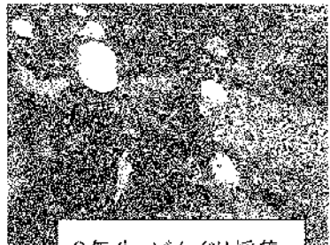
3年生 どんぐり採集

今年度も、太陽生命さんの協力をいただき『どんぐりプロジェクト』を実施しています。この事業は2011年から始まったもので、本校児童が3年間かけてくつきの森に生息するどんぐりから苗木を育て、6年生で「太陽生命くつきの森林」に植樹するというものです。森林の役割や保全をはじめとして、自然環境の大切さを学ぶ体験学習として実施しており、3年生はどんぐりの植え付けや標本づくり(10月22日実施)、4年生は苗木植替え作業(10月21日実施)、5年生は森林のはたらきに関する学習(10月21日実施)を行いました。プロジェクト最終となる苗木の植樹式(6年生)は、12月3日(金)に実施予定です。