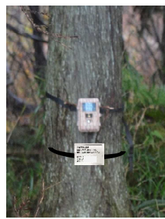
図4：センサーカメラ