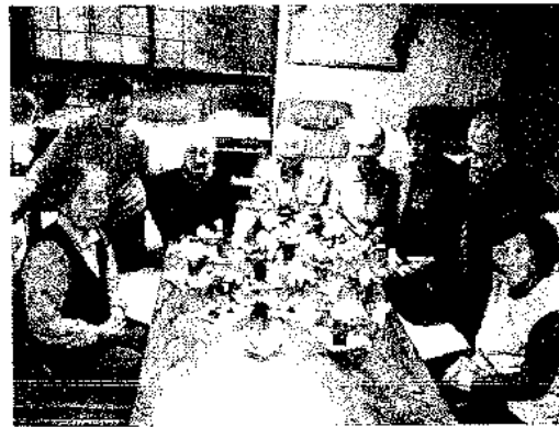
(アレンジフラワー作り)