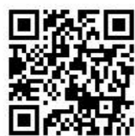
リアルタイム 高島(登録)

避難情報や気象情報、雨量、河川水位などをメールで受信するために、 事前に高島市や滋賀県の防災メールサービスを登録しておきましょう。