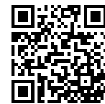
気象警報・注意報 高島市、滋賀県北部 の早期注意情報 (警報級の可能性)