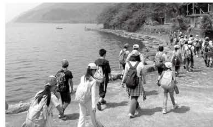
↑永原駅からマキノサニービーチまで歩きました

6月13日(土)には、2回目の活動「びわ湖・湖岸ウォーク」を行いました。体験活動の一環として子どもたちが自ら切符を購入し、自宅の最寄り駅から電車に乗って永原駅に集合。永原駅から琵琶湖岸をマキノサニービーチまで歩きました。約10kmの暑くてつらい道のりでしたが、参加者全員が頑張って完歩しました。初夏の景色と心地よい風は疲れを吹き飛ばしてくれました。(高島市青少年育成市民会議)