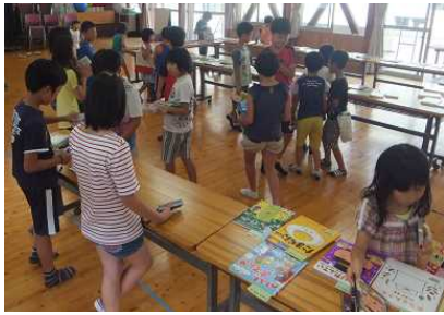
バーコード読み取りもす～いすい

小さい頃から読書習慣を身につけさせて『もの知りで賢い子に育てたい』と願い、今年度も朽木図書サロンと連携して図書貸出日を設定しています。図書ボランティア“ほっとけーき”さんと児童図書委員は、左写真のように大忙しです。