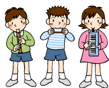
プレゼントをたくさん もらって6年生が退場