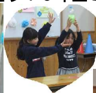
2年生: 手品・クイズ・演奏