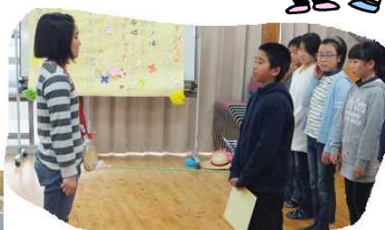
5年生: プロデュース 縦割りゲーム 誰かなクイズ