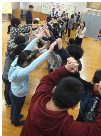
エンディングアーチ