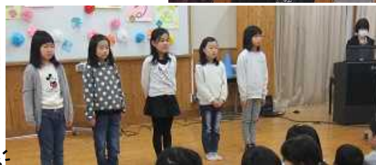
3年生: 歌(アカペラ ♥ ハーモニー)