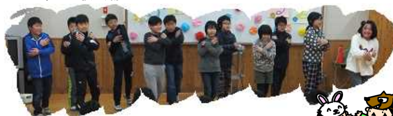
4年生: Let's ダンス!