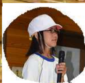
◇「最後の運動会 頑張りました!」 6年児童代表の言葉