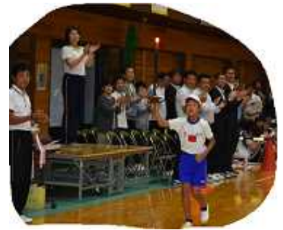
◆“友情の火” 堂々の入場