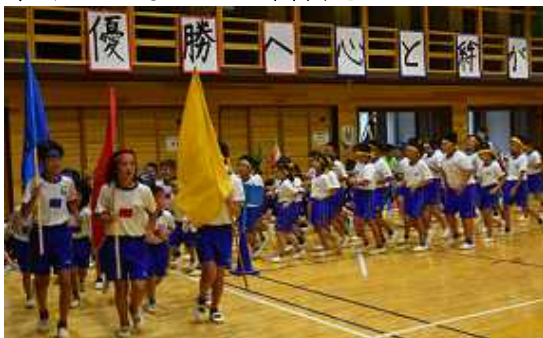
◆戦い終わって... 整然と仲良く退場