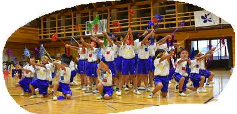
◆可愛くりズミカルな DANCE “OLA!”