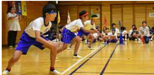
◆いざ! ダッシュ走で 勝負!!