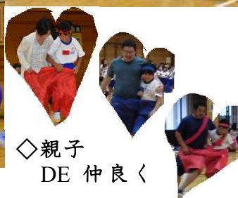
◇親子 DE 仲良く