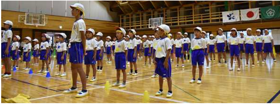
◆背筋をピンと伸ばしてしっかり聞く