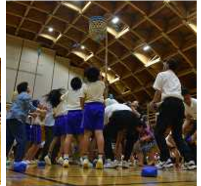
◆来賓の方も一緒に玉入れ