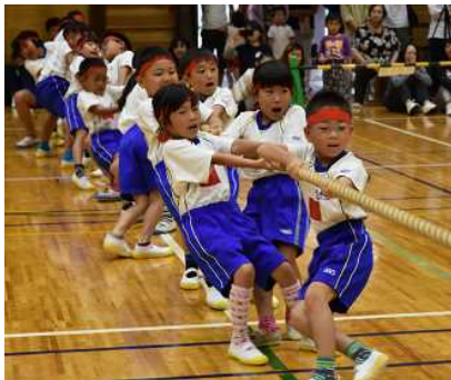
◆力のこもった 綱引き