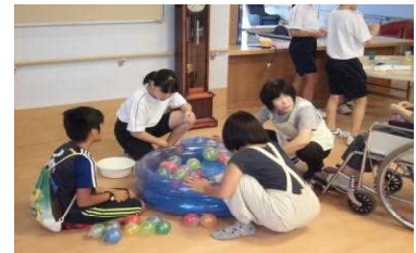
【東小運動会 9 月 16 日】