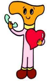
はなしてなごむ君